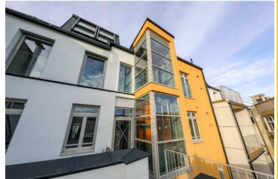
Projekt Zwölfergasse