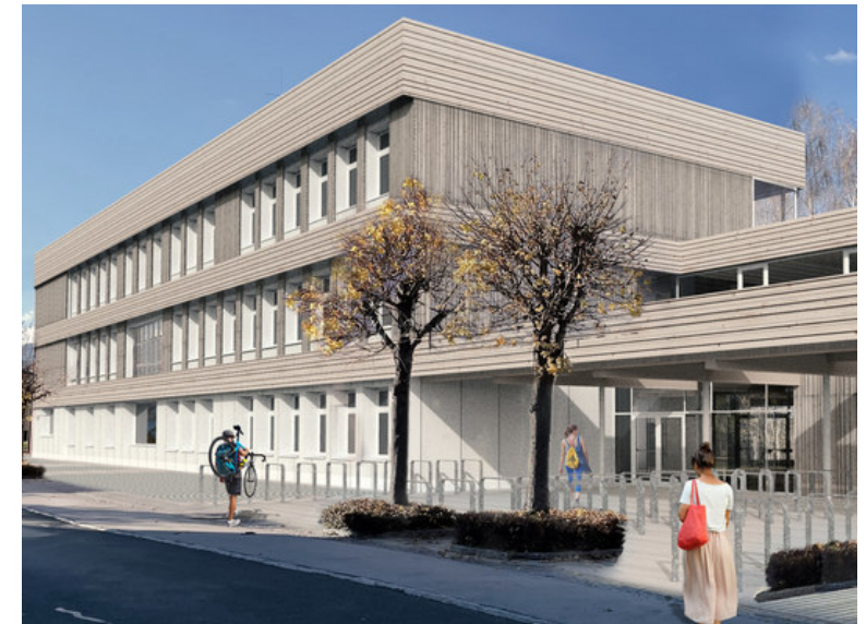
BORG Radstadt, Sanierung Moosallee 7, 5550 Radstadt, Salzburg, Klimaaktiv Silber, Planungsdeklaration, Sanierung

Klimafitte Gemeinden durch Bürger:innenbeteiligung, klimaaktiv